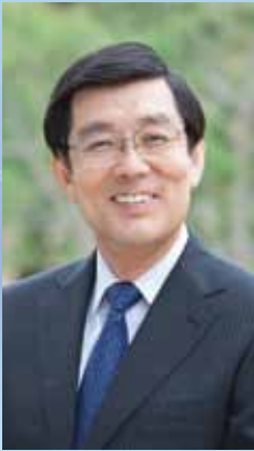
ダニエル・ハブキ アメリカ創価大学学長